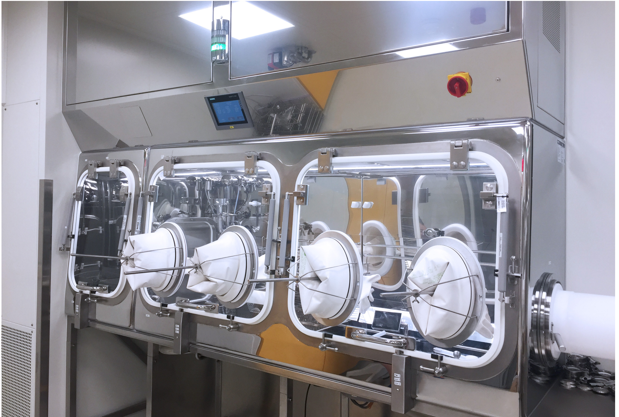
Isolator for product protection | Praha Vaccines a.s. | Czech Republic