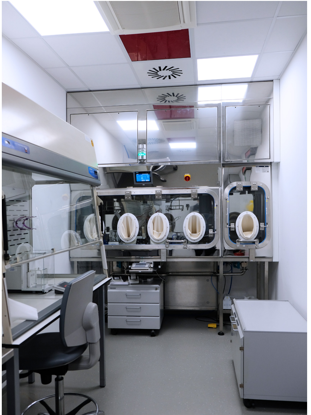
Isolator workplace | Synthon, s.r.o. | Czech Republic