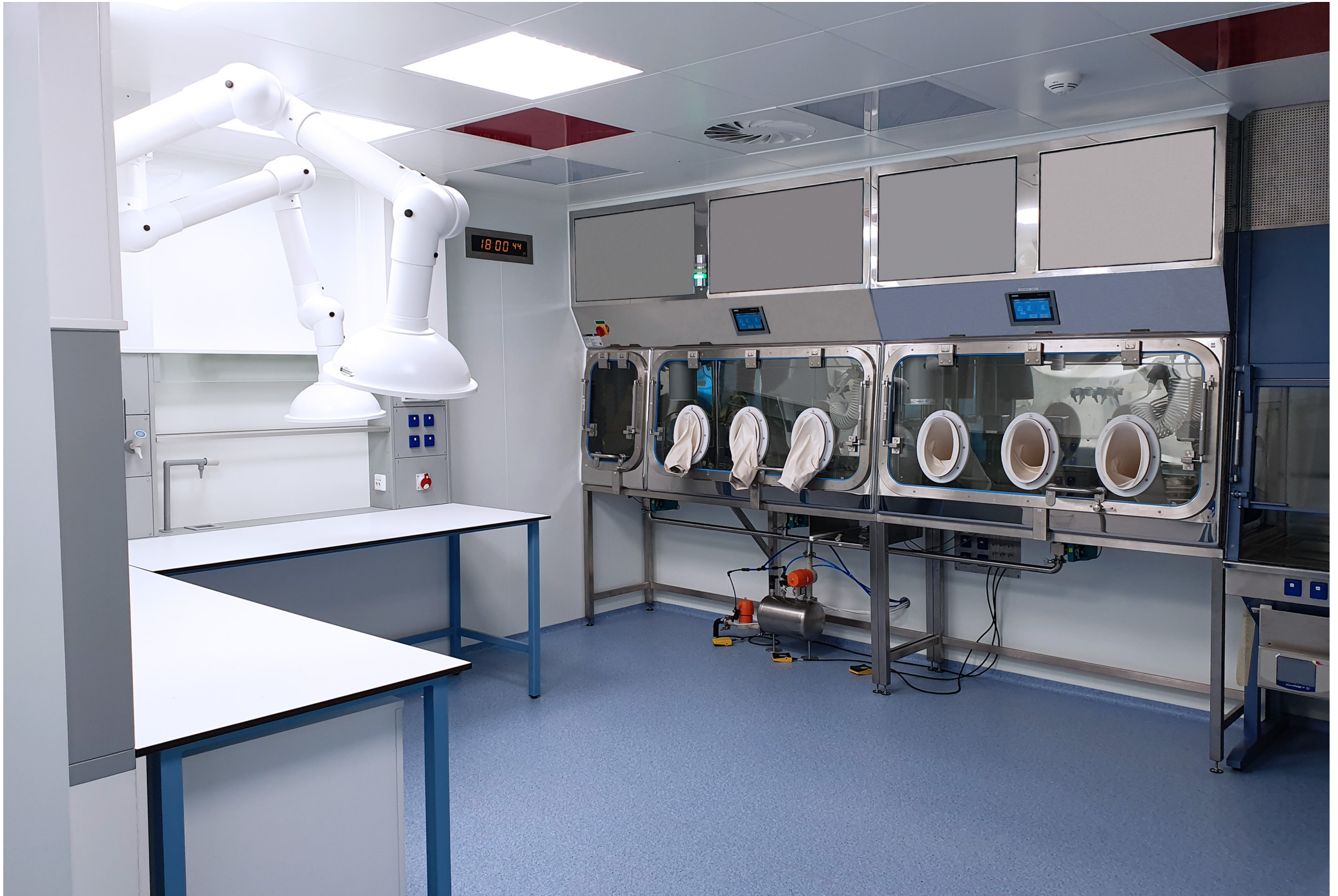
Isolator workplace | Synthon, s.r.o. | Czech Republic